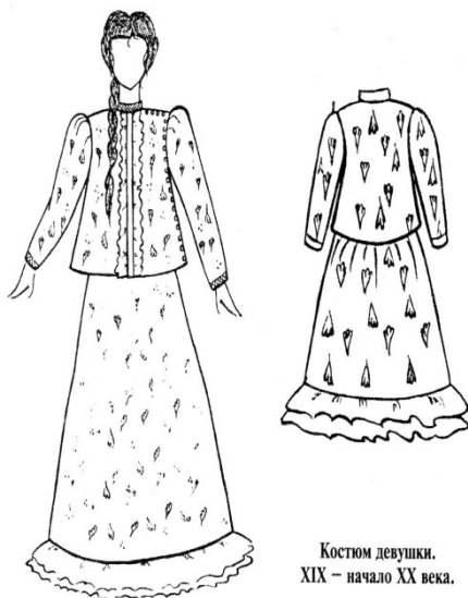
Костюм девушки. XIX – начало XX века.