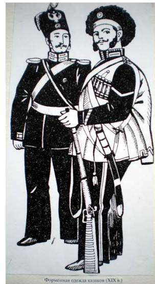
Форменная одежда казаков (XIX в.)